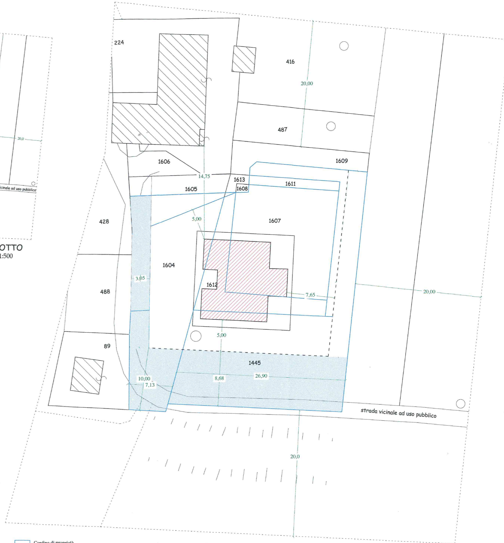
— Confine di proprietà ▨ Fabbricati esistenti ▨ Fabbricato in progetto ■ Area da cedere al Comune mq 395 come indicato nella scheda norma Ambito 17 INGRANDIMENTO LOTTO STATO MODIFICATO - scala 1:200