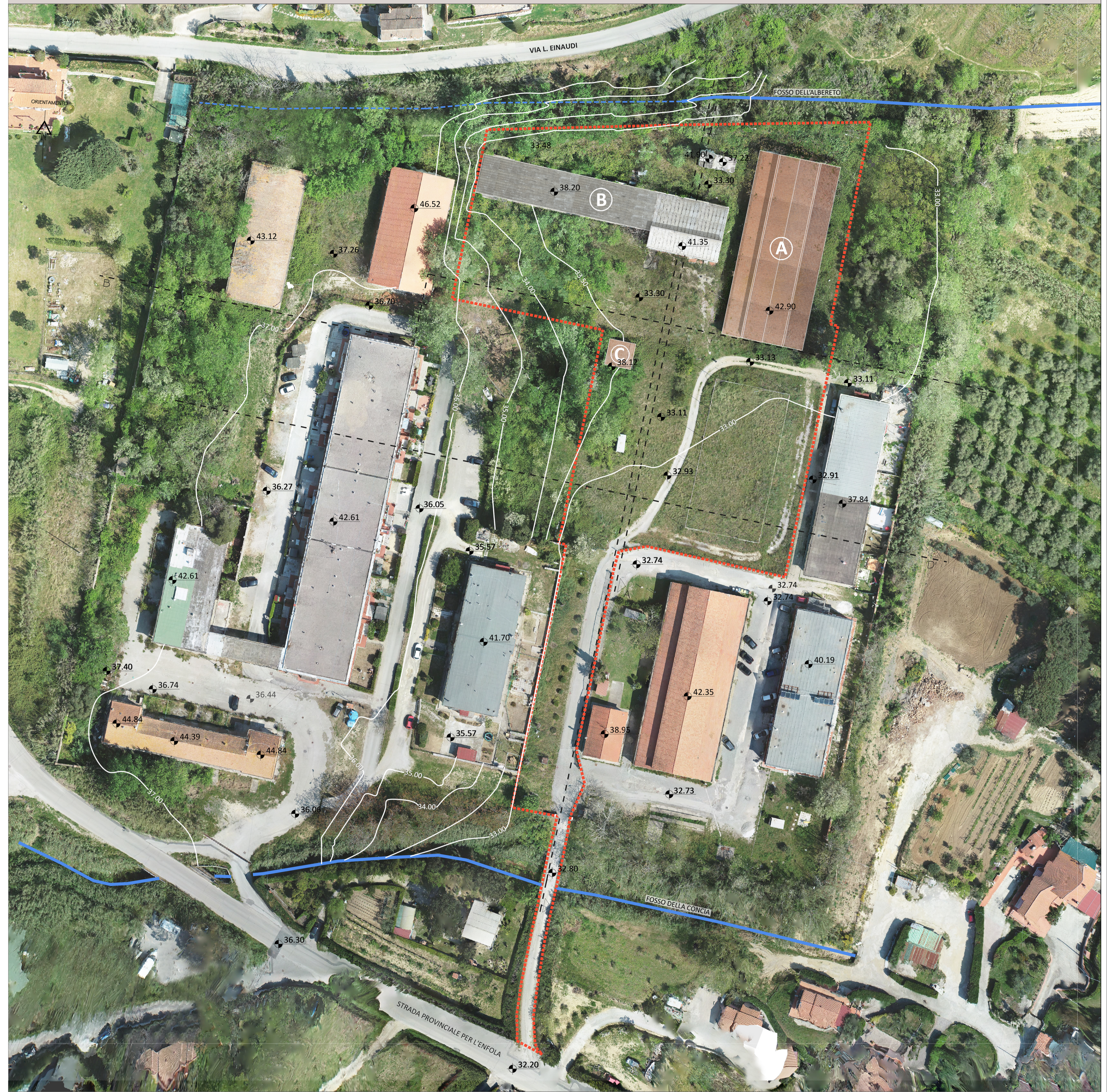
PLANIMETRIA GENERALE SCALA 1:500

Rilievo fornito a cura dell'Ing. Francesco Longhi F. 326 - Piano Attuativo Maggio 2021