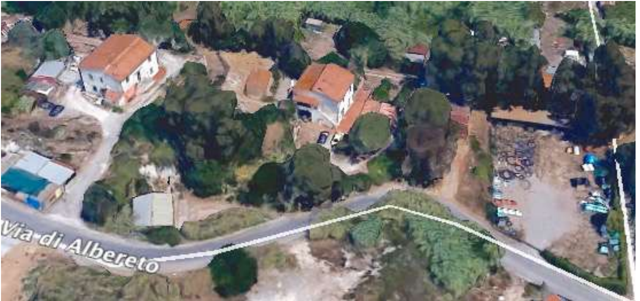
Vista aerea con individuazione dei manufatti esistenti